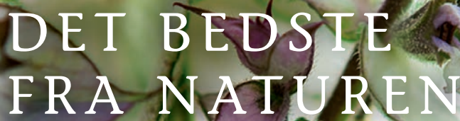
Foto: Muskatelsalvie (engelsk: Clary Sage)